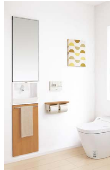
※写真はバーチ柄です。